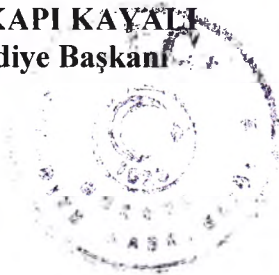
Ömer YILDIRIM Katip Üye